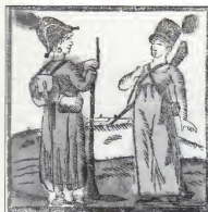
Het Meisje, zwak en roef van aard Door siggeniet verwonnen. Verleijft hier in 's follootepalk - Nijj dunkt, 's is ontbennen.

geen bedreiging van de bestaande orde. Als vrouw hadden zij zich vrouwelijk gedragen. Eenmaal getransformeerd tot man gedroegen zij zich zoals dat van mannen verwacht kon worden.